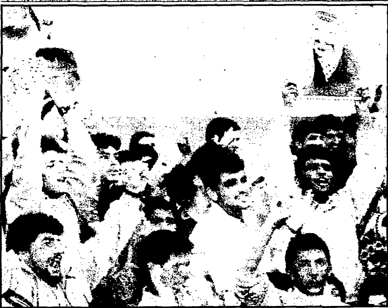
جانب من احتفالات غزة في ذكرى انطلاق حركة فتح

واشنطن ولندن تؤكدان الحكم في السعودية مستقر وفي ايد امينة